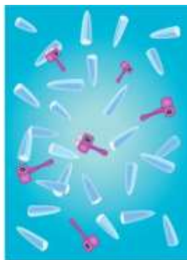
Subunit vaccine: purified HA and NA antigens