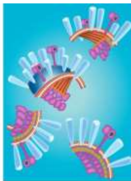
Split-particle vaccine: split particles in a highly purified form